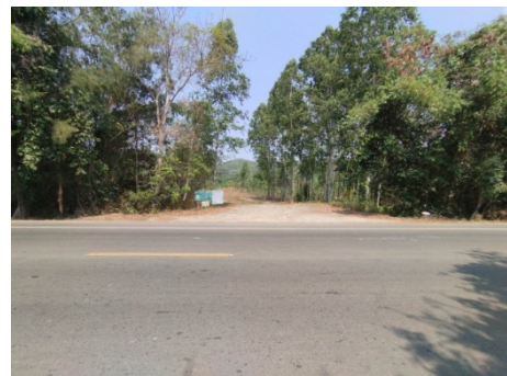
เส้นทางเข้าสู่พื้นที่โครงการ