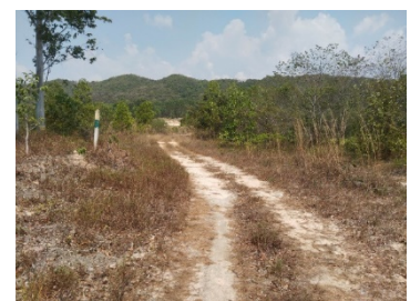
แนวเขตไม่ทำเหมือง